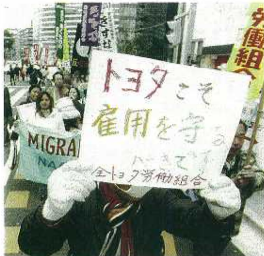
トヨタ関連企業などの「派遣切り」に抗議し、プラカードを掲げるデモ参加者=23日、名古屋市中村区

ず、景気の先行きも不透明。失業者や中小企業への支援も重要度を増す。財政担当職員は「もう鼻血も出ない」と頭を抱えるが、少ない財源で効果的施策を求められる厳しい情勢が続くそうだ。